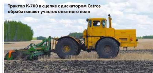
Трактор K-700 в сцепке с дискатором Catros обрабатывают участок опытного поля