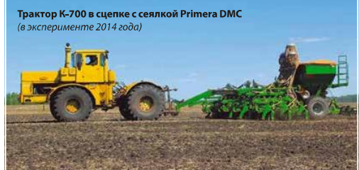
Трактор K-700 в сцепке с сеялкой Primera DMC (в эксперименте 2014 года)