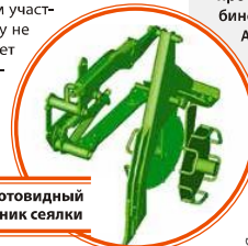
Долотовидный сошник сеялки

tel.: +7-919-337-03-77, e-mail: Andrey.Krasnoborov@amazone.ru